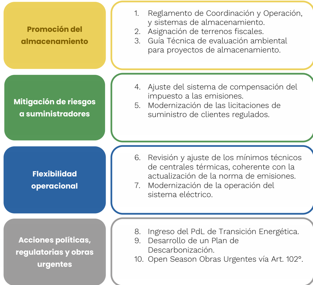
Figura 2: Resumen del Plan de Medidas de Corto y Mediano Plazo para la Transición Energética Acelerada.