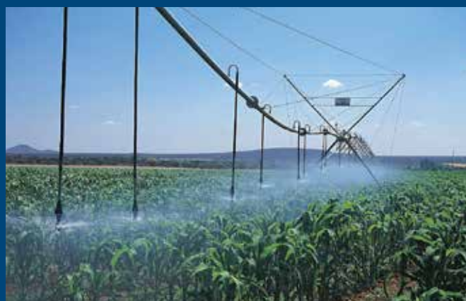
Riego por pivotes