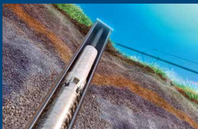
Bombas de pozo