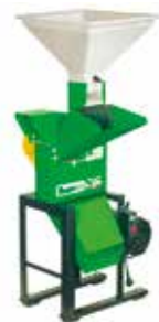
TRF 300 ELÉCTRICO