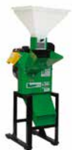
TRF 80 G