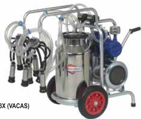
BS 3X (VACAS)