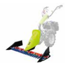
KIT DE SEGADO MOTOCULTIVADOR G55