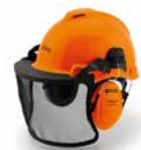
CASCO FUNCTION UNIVERSAL