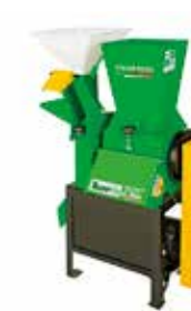
TRF JK 700