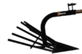
COSECHADOR DE PAPAS