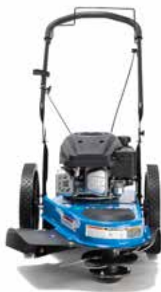
CORTADORA DE PIOLA MATCH