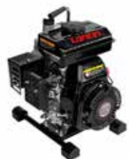
LONCIN 1,5"x 1,5"