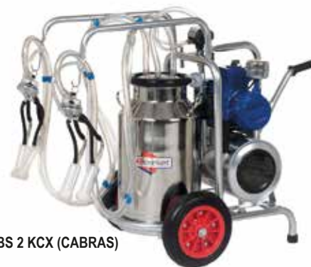
BS 2 KCX (CABRAS)