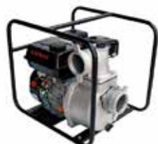
LONCIN 3"x 3"