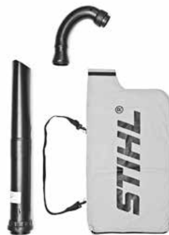
DISPOSITIVO DE ASPIRACIÓN