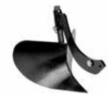
SURCADOR RETROFRESA MOTOCULTIVADOR G45