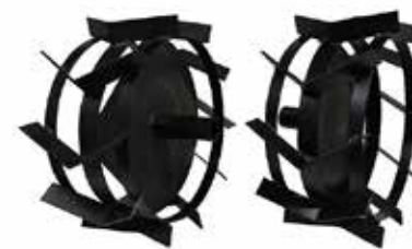
JUEGO DE RUEDAS