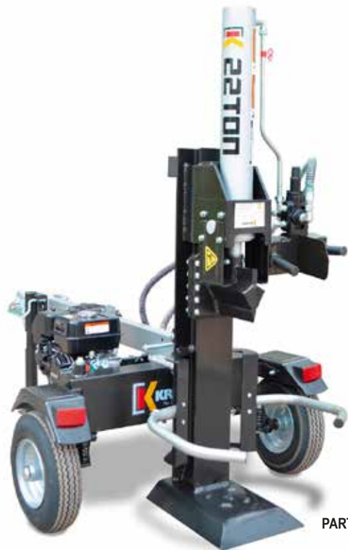
PARTIDOR DE LEÑA LSE 22