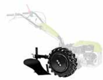
KIT DE ARADO MOTOCULTIVADOR G55