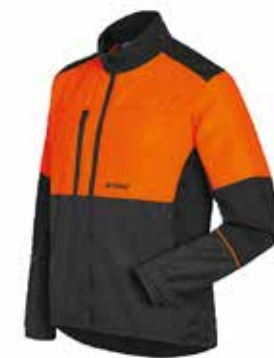
CHAQUETA FUNCTION UNIVERSAL