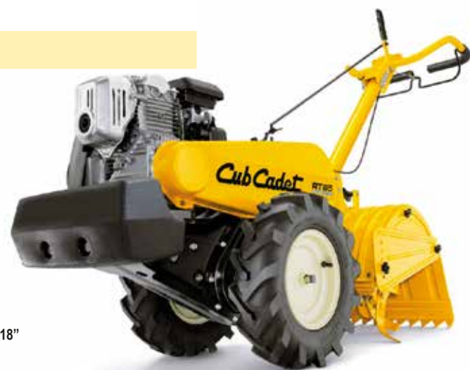
CUB CADET 18"