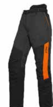
PANTALÓN FUNCTION UNIVERSAL