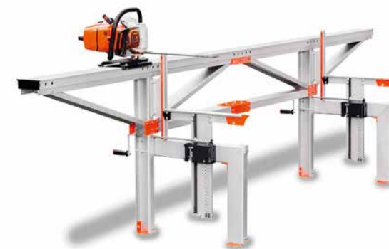
F2 (No Incluye Motosierra)