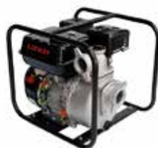
LONCIN 2" x 2"