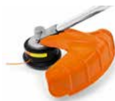
CABEZAL FS (NO INCLUYE HERRAMIENTA DE CORTE)