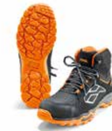
BOTÍN DE PROTECCIÓN