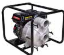
LONCIN 3"x 3" TRASH