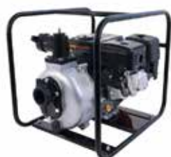
LONCIN 2" X 2" AP