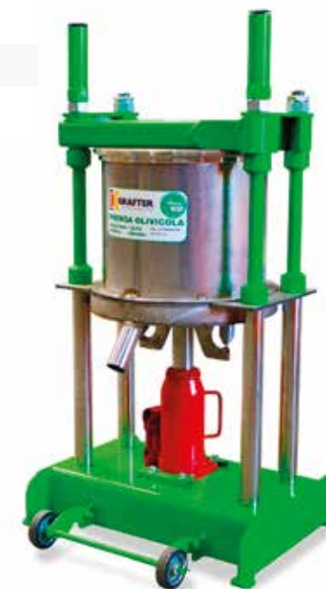
PRENSA HIDRÁULICA MANUAL