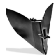
SURCADOR RETROFRESA MOTOCULTIVADOR G55