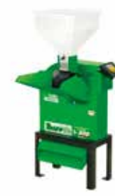
TRF 800 SIN MOTOR