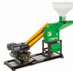
TRF 700 G