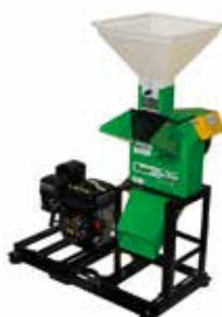
TRF 300 G