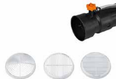
REJILLAS DE FUMIGACIÓN