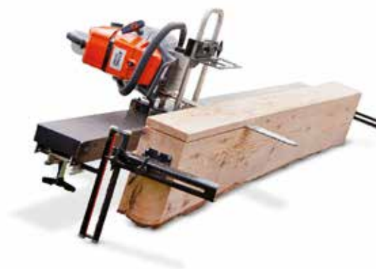
Big Mill (No Incluye Motosierra)