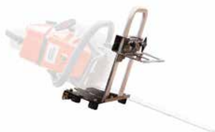
TIMBERJICK (No Incluye Motosierra)