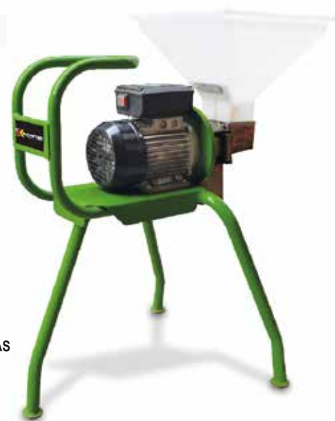
TRITURADOR DE ACEITUNAS