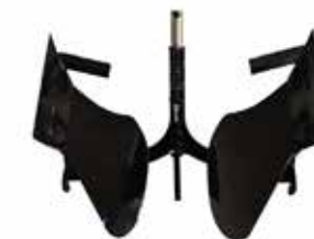
ARADO DOBLE 180°