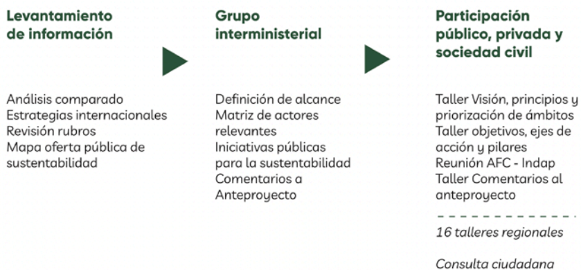
Figura N°1. Proceso de elaboración de la Estrategia de Sustentabilidad Agroalimentaria