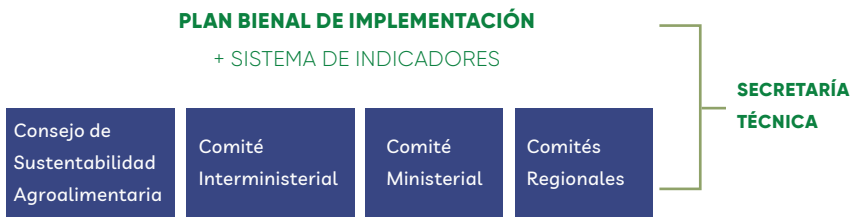
Figura 2. Esquema de la implementación de la Estrategia de Sustentabilidad Agroalimentaria

Durante 2021 Odepa definirá este sistema, el que será de acceso público a través del sitio web correspondiente.